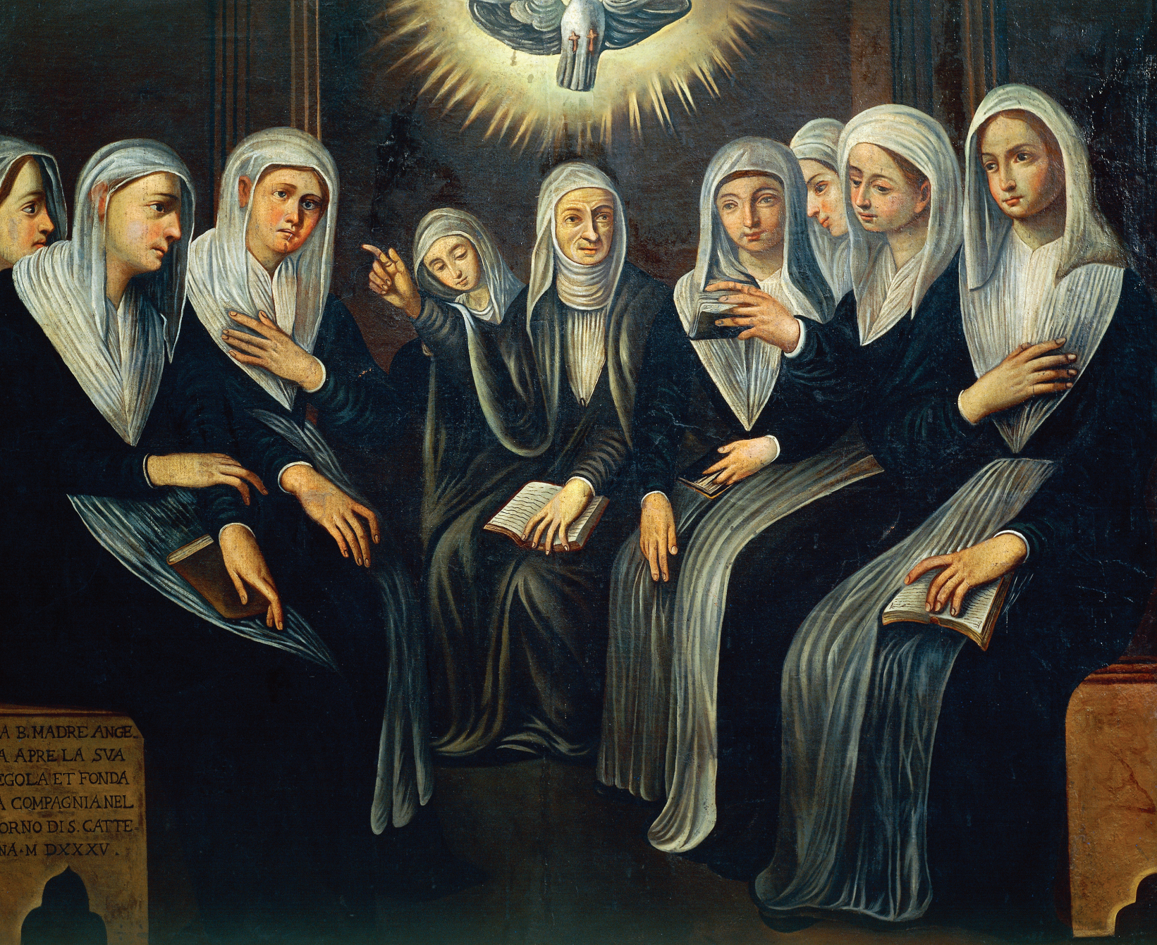
אנג'לה מריצי מסבירה את עיקרי התקנון האורסוליני לחסידותיה, המאה השבע-עשרה

נדרי נזירות מלאים וקבועים אלא נדרים פרטיים וזמניים, שהאורסוליניות חידשו מדי שנה בשנה. אורסוליניות שמאסו בחיי המסדר יכלו להימנע מחידוש נדריהן, לשוב למשפחותיהן ולתבוע מהן נדוניה שתאפשר להן להינשא – מצב שמשפחות האליטה הסתייגו ממנו. בעקבות לחצי המשפחות אולצו כל האורסוליניות בצרפת להפוך לנזירות לכל דבר ולנדור את נדרי הנזירות המלאים, שחייבו אותן לשארית חייהן. במהלך המאה השבע-עשרה נאסר על כל קהילות האורסוליניות לעסוק בפעילות חינוכית מחוץ למנזריהן, אם כי בכל מנזר הותר להן לשכן באגף ייעודי תלמידות בתנאי פנימייה. האורסוליניות אמנם