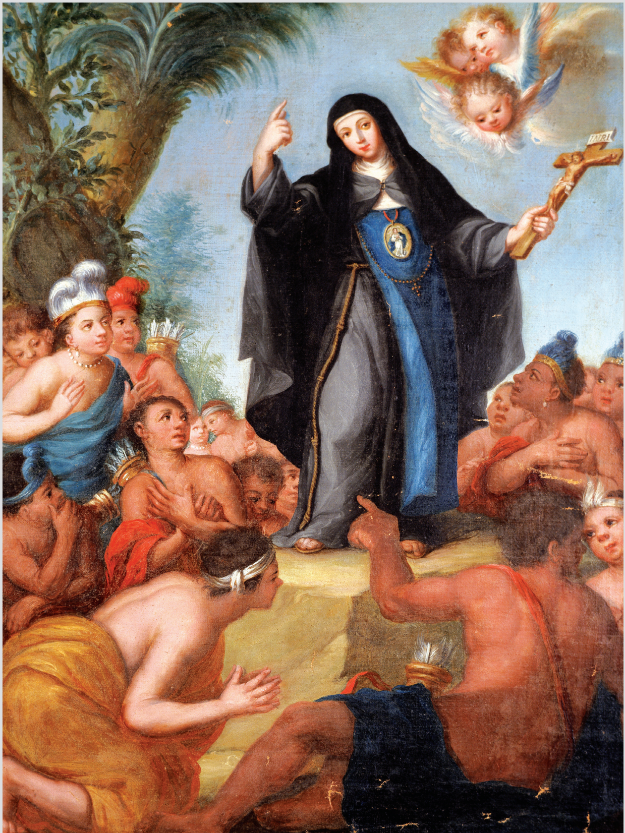
מריה דה אגרדה (de Ágreda) מתגלה בפני ילידי יבשת אמריקה, ציור ספרדי מהמאה השבע-עשרה