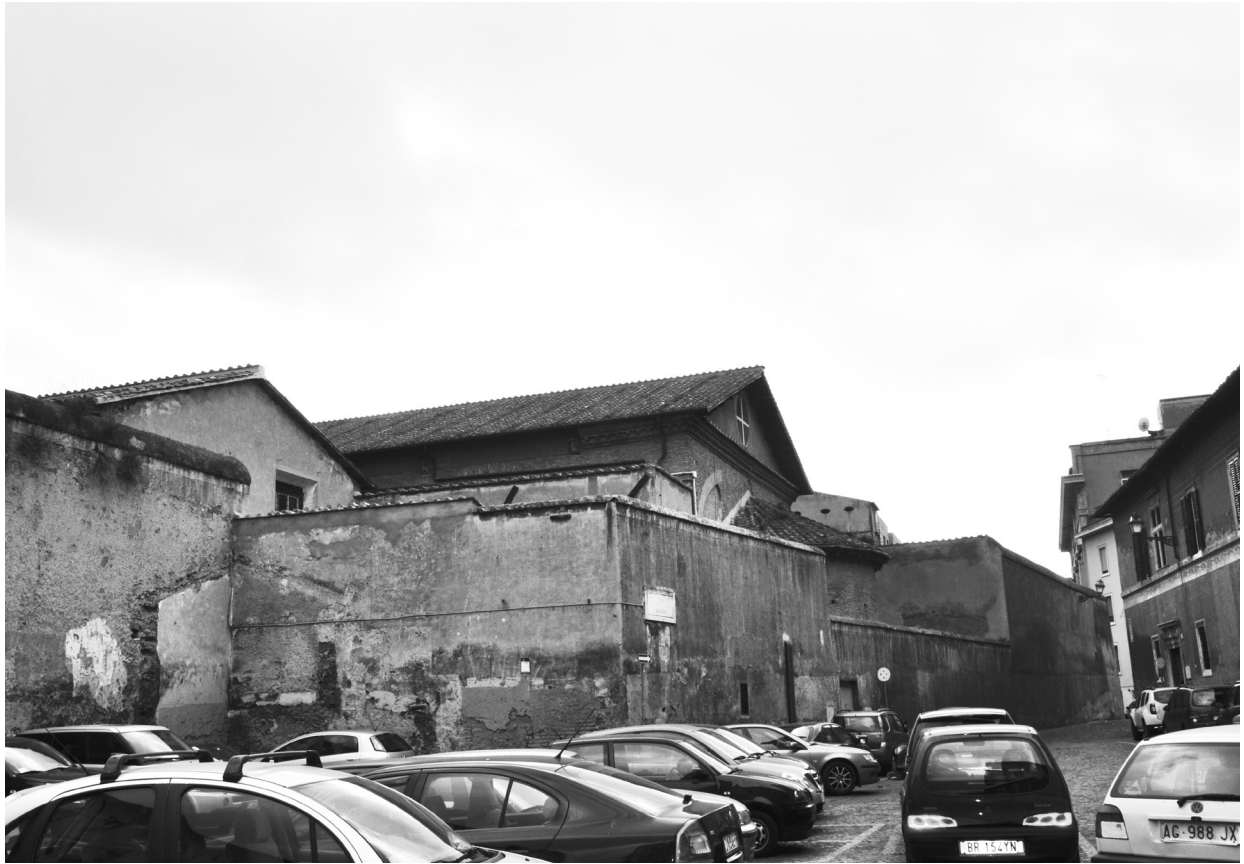
מנזר סנטה צ'ציליה אין טרסטוורה (Trastevere) ברומא. למעלה: החומה החיצונית; למטה: חלון פנימי בכנסייה שדרכו היו אמורות הנזירות לראות את הנעשה בכנסיית המנזר שלהן