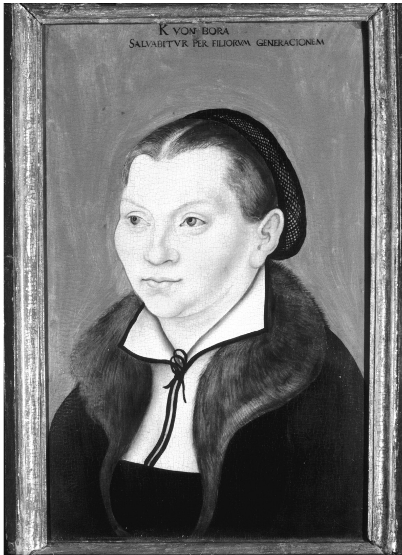
הנזירה קתרינה פון בורה (von Bora), שנישאה ללותר, בציור של לוקאס קראנאך האב, שמן על לוח, שנת 1529

הכרוכות בהיריון ובלידה, שהיו גורמי התמותה העיקריים של נשים בגיל הפוריות בתקופה זו – נשאו החיים בקהילות נשים יתרונות שאפילו ביקורתם החריפה של הרפורמטורים הפרוטסטנטים על מוסד הנזירות לא הצליחה להעלים. לא במקרה בחרה בשלהי המאה השבע־עשרה הוגת הדעות האנגלייה מרי אסטל (Astell, 1666-1731), שגדלה כאנגליקנית, לאמץ את מודל המנזר כמרחב אידיאלי שבמסגרתו יכולות בנות המין הנשי לעסוק בחשיבה ובלמוד בלי להיות כבולות לתפקידים שנכפים עליהן במסגרת המשפחתית.