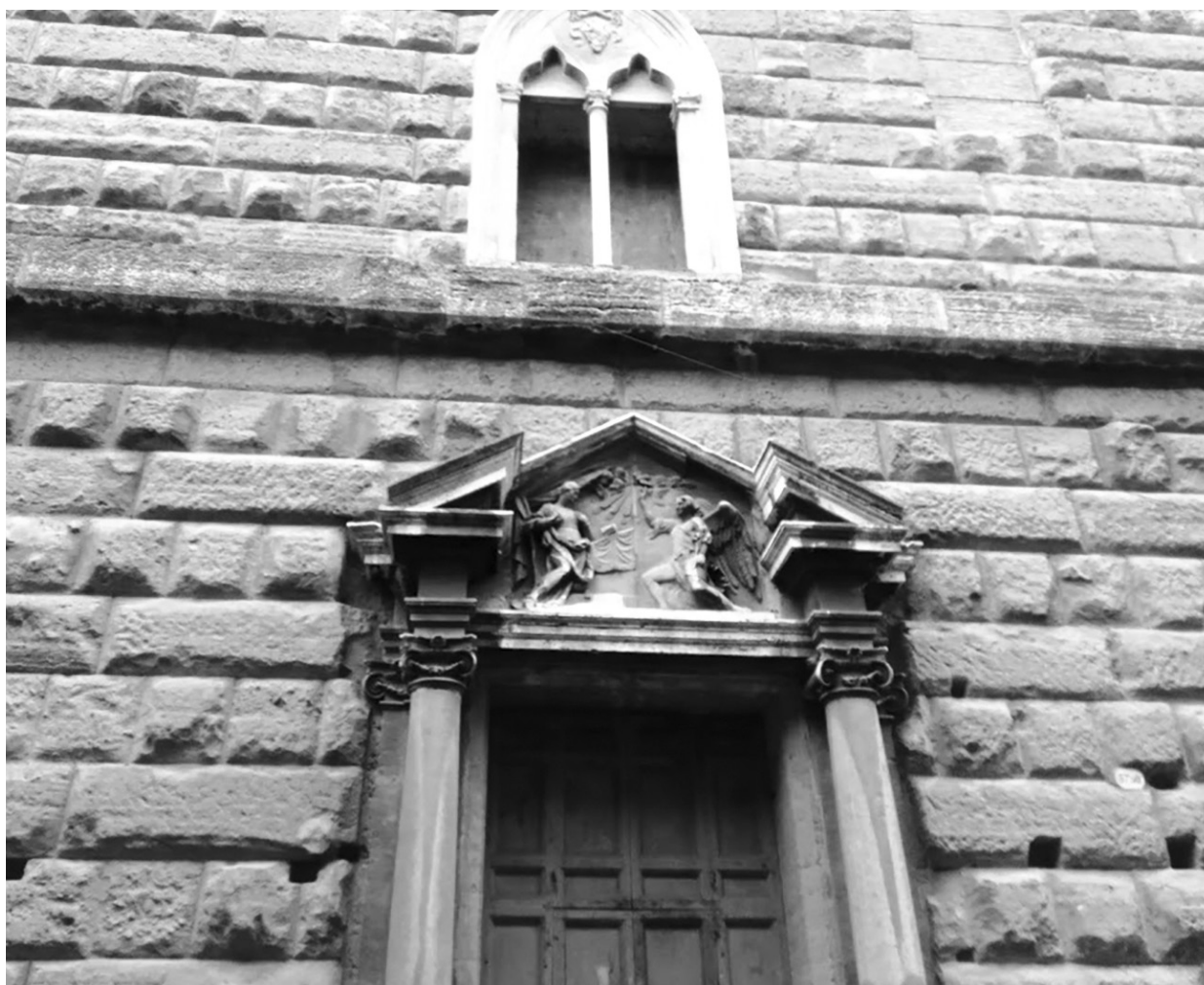
חזיתו של SS. Annunziata all'Arco dei Pantani, המנזר שהוקם ברומא בשנת 1562 לקליטת מומרות מהיהדות שקיבלו על עצמן את נדרי הנזירות